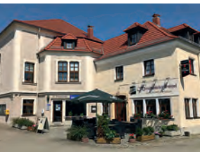
Herrschaftlicher Gasthof, Neschwitz