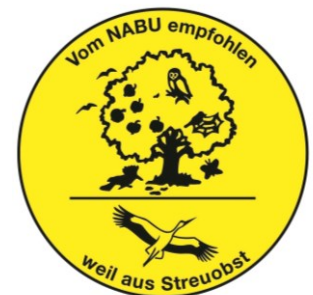
NABU-Qualitätszeichen für Streuobsterzeugnisse